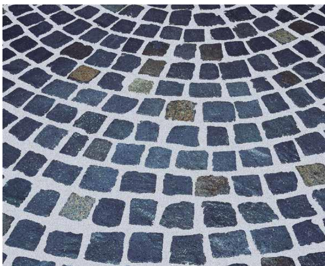
10 Gotowa, zafugowana nawierzchnia brukowa.