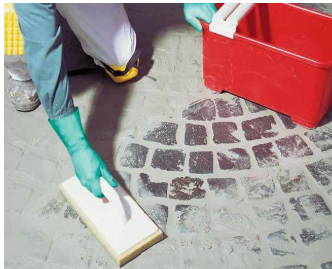
8 ... lub pacą gąbkową.