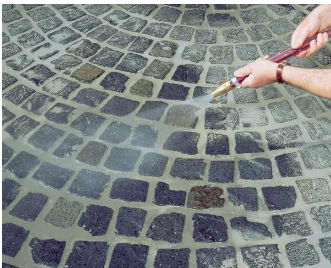
9 Zmywanie zaspoinowanej powierzchni po wstępnym związaniu zaprawy fugowej przy pomocy węża z końcówką do zraszania.