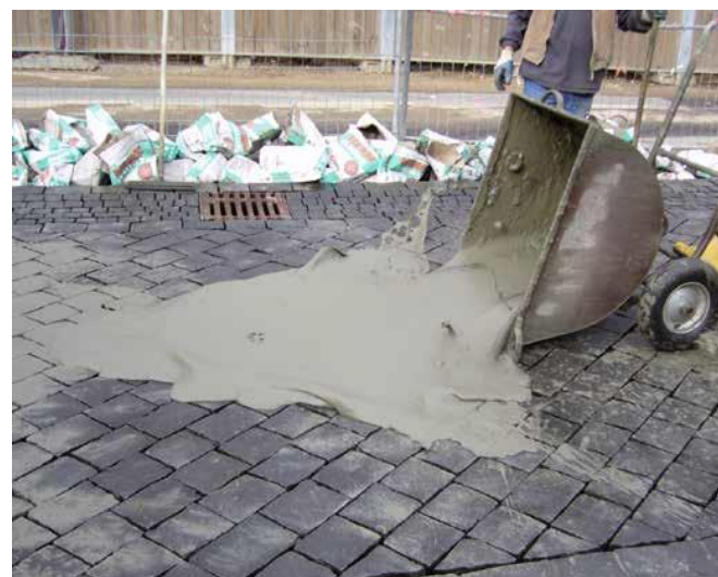
5 Łatwe wypełnienie szczelin dzięki doskonałej rozpląwności fugi.