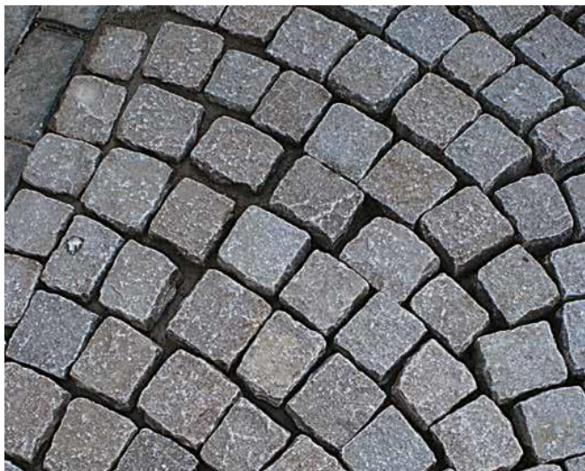
1 Nawierzchnia z kamiennej kostki brukowej o różnej szerokości szczelin spoinowych.