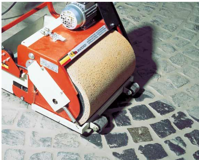
7 Zmywanie zaspoinowanej nawierzchni przy pomocy maszyny do zmywania fug...