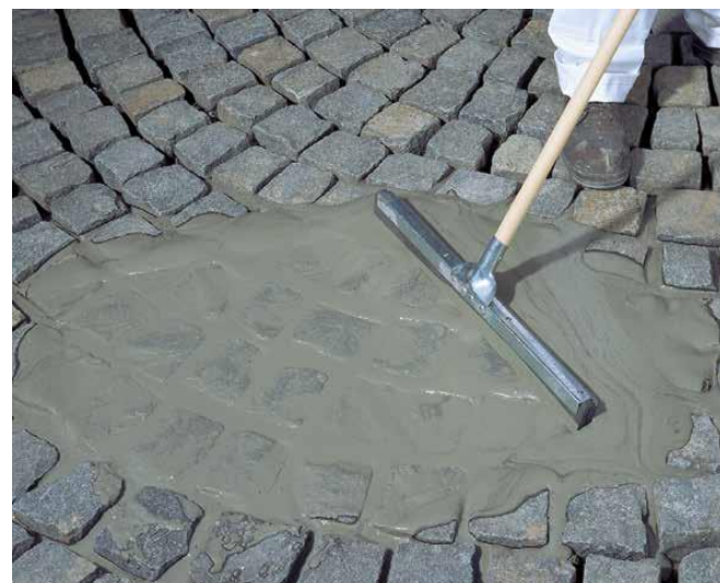
6 Wypełnienie spoin samozagęszczającą się zaprawą Sopro PFM.