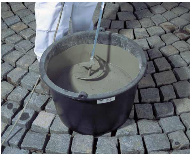
3 Mieszanie fugi Sopro PFM przy pomocy mieszadła śrubowego.