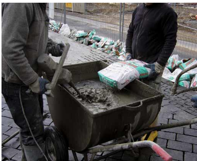
4 Alternatywnie: mieszanie fugi przy pomocy mieszarki do zapraw.