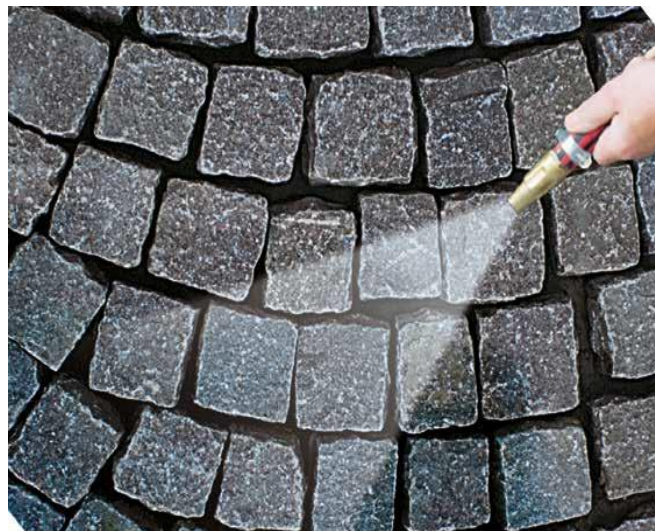
2 Nawilżona i oczyszczona nawierzchnia przygotowana do spoinowania.